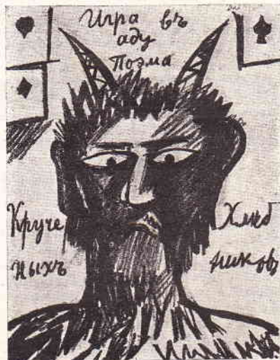
Обложка поэмы «Игра в аду».

Здѣсь клятвы знаютъ лишь на златъ, Приблтый долго здѣсь нищаль, Одежды странны: на запяты Надежды лучъ протренигаль. Любимецъ вадкъ, вависцъ красы, Нодъ ножъ тоскливый подезентъ, Ничкомъ упалъ онъ на сѣси И чубъ бланый, чьмъ лентъ.