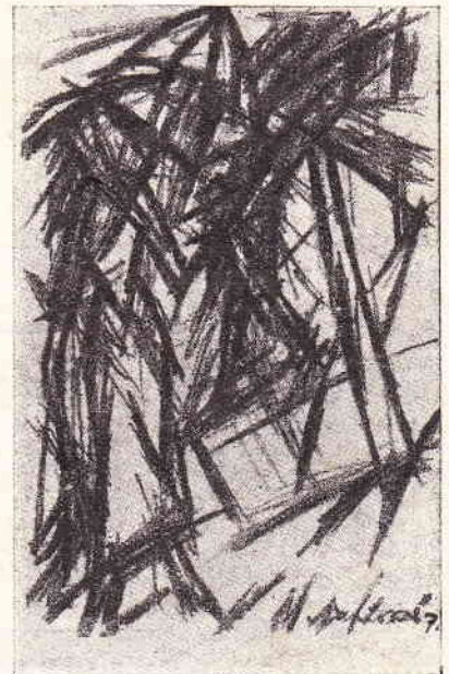
Иллюстрация изъ книжки.

И вотъ разрываю и стружки. Какъ змѣйки въ воздухѣ дрожать, Такія рывья иерушки Глаза сожженныхъ свѣтятъ. Любовницъ горь, отравы смя, Надъ мертвымъ долге тототалъ,